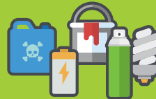
RÉSIDUS DOMESTIQUES DANGEREUX