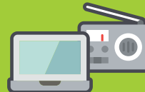
APPAREILS ÉLECTRONIQUES ET INFORMATIQUES